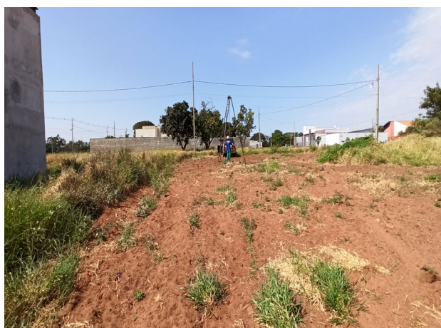
FOTO 5 - SONDAGEM A PERCUSSÃO