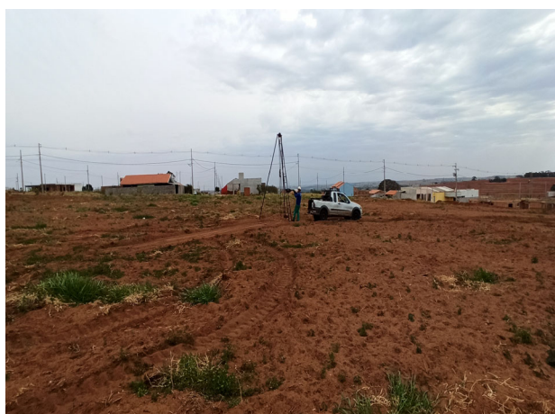
FOTO 6 - SONDAGEM A PERCUSSÃO