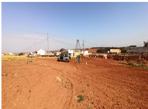
FOTO 3 - SONDAGEM A PERCUSSÃO