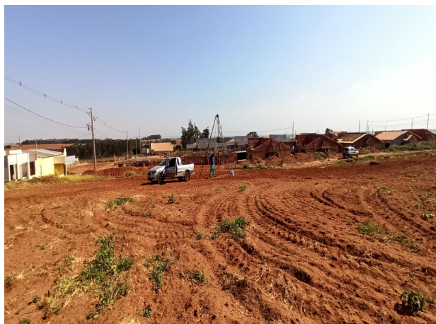
FOTO 2 - SONDAGEM A PERCUSSÃO