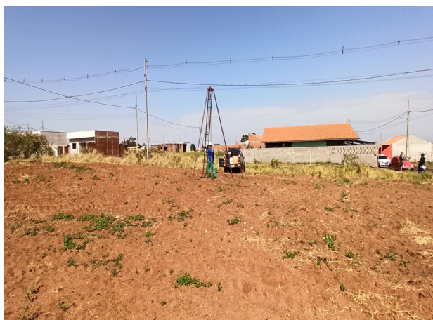
FOTO 4 - SONDAGEM A PERCUSSÃO