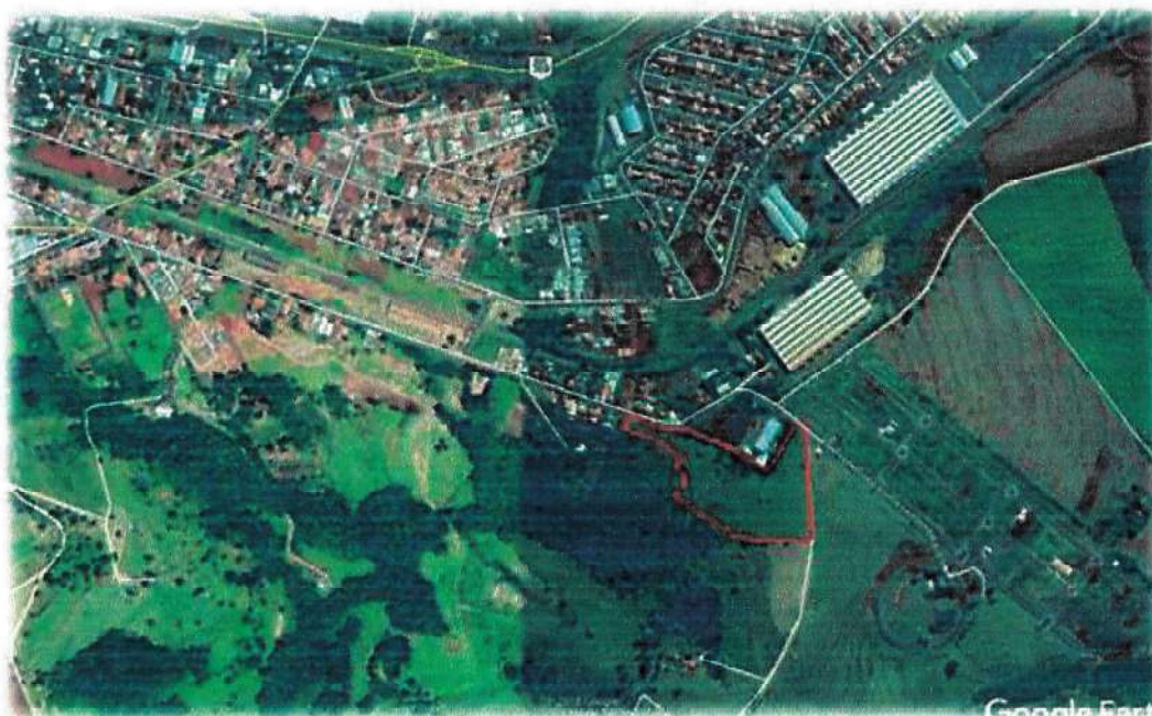
Figura 1- Localização da área do empreendimento no Município de Jandaia do Sul – PR.

O estudo foi realizado em uma área representada pelo Lote nº 23-1 com área de 30.506,00 m 2 da Gleba Patrimônio Jandaia, município de Jandaia do Sul e estado do Paraná, conforme mostramos na figura 1.