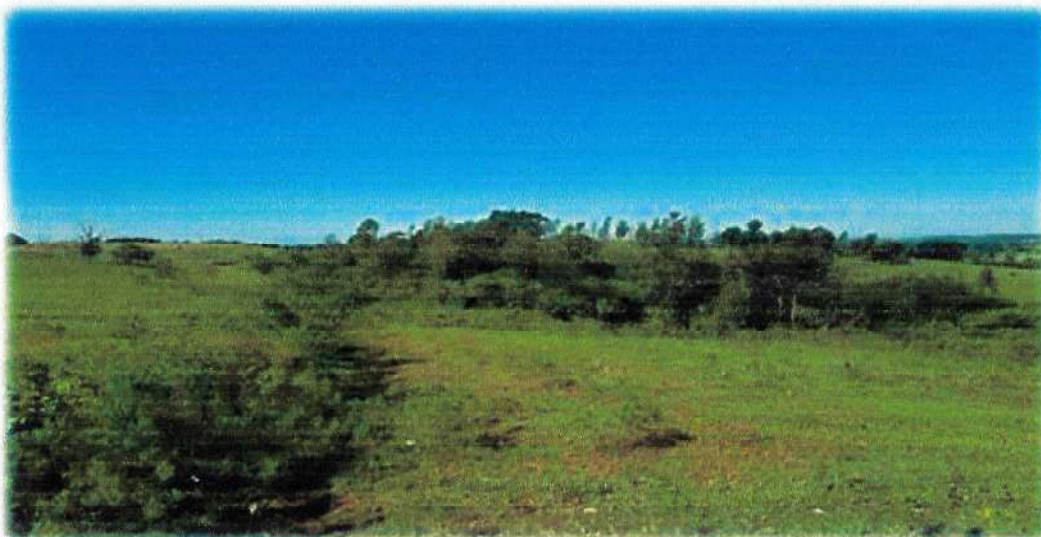
Foto 4- Pequena erosão proveniente de chuvas, sua maior parte fica no lote 23-REM (vizinho).