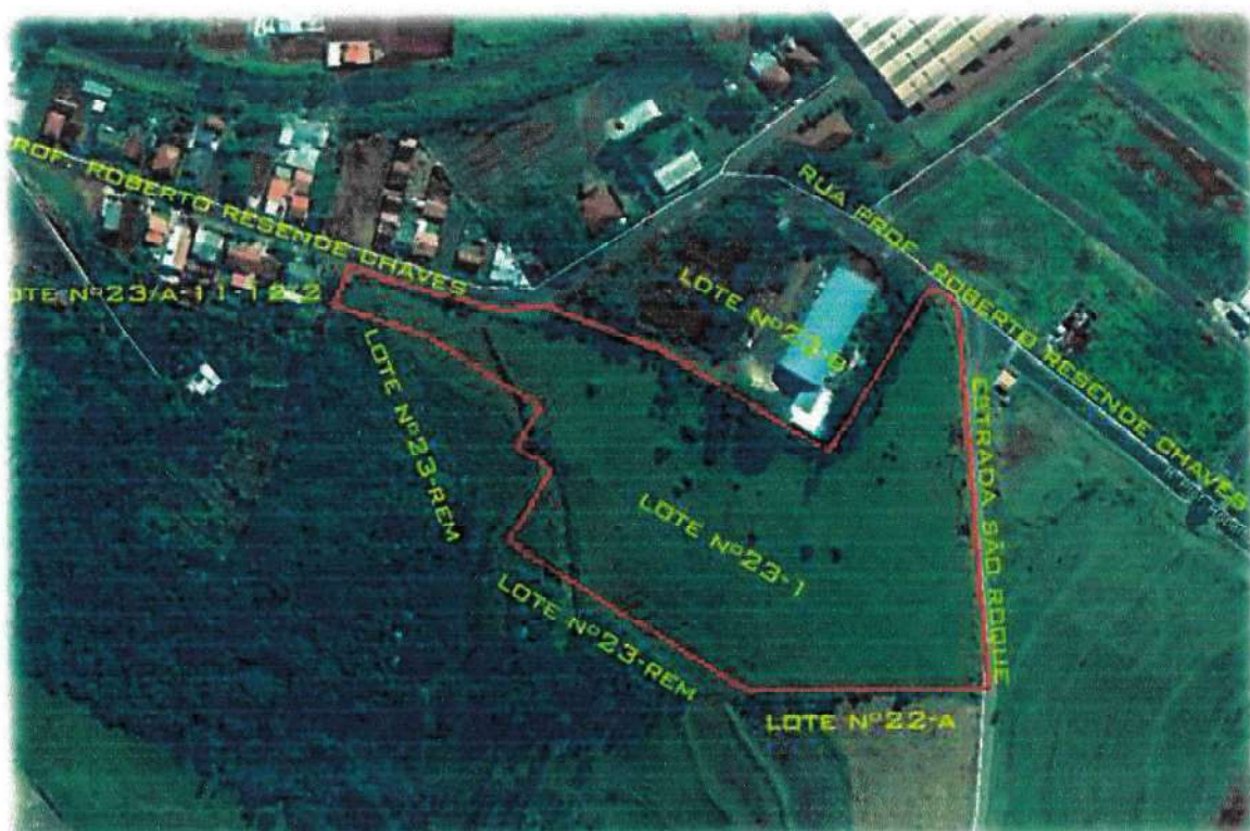
Figura 2- Localização da área do empreendimento no Município de Jandaia do Sul – PR.