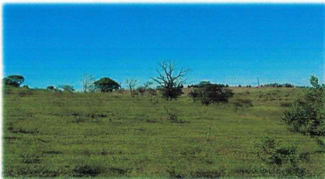
Foto 3- Algumas Espécies Arbóreas e Vegetação do Lote nº 23-1.